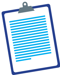
Documenten je toestemming en vergunning