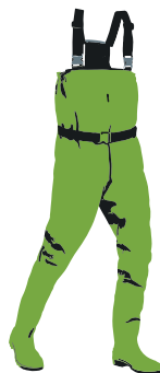
Waadpak of lieslaarzen