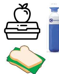
Voedsel eten & drinken