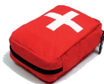
EHBO-spullen, o.a.: pleisters, tekentang, desinfecteermiddel