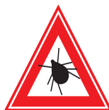
Kleding bij voorkeur teek- werende kleding