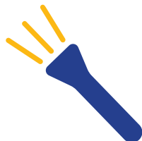
Zaklamp met extra batterijen