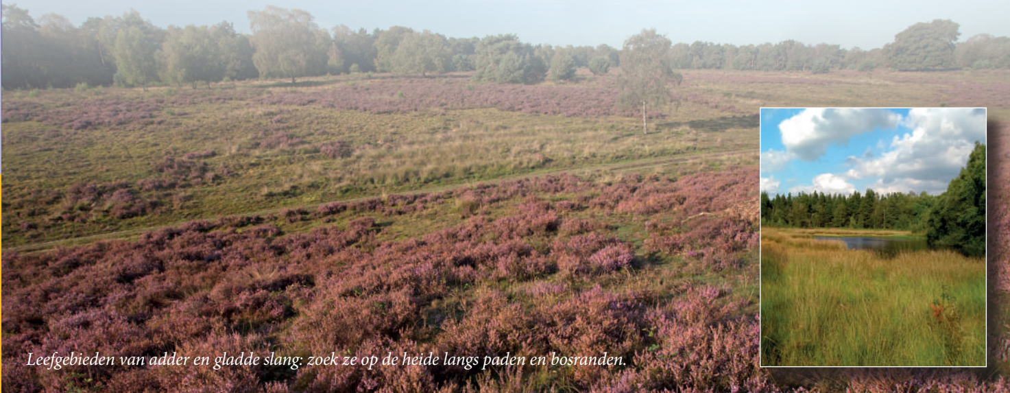
Leefgebieden van adder en gladde slang: zoek ze op de heide langs paden en bosranden.

De adder en gladde slang leven voornamelijk op heide- en hoogveenterreinen, maar ook in kruidenrijk grasland, bermen, halfopen bos en langs bosranden. Zo kun je ze bijvoorbeeld zonnend aantreffen langs of op de paden die door de heide lopen. Soms liggen ze verdekt opgerold in de vegetatie of steken ze fietspaden en wegen over.