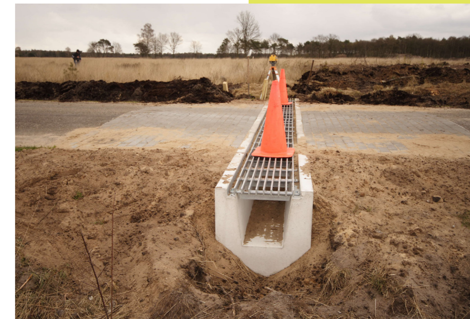
Faunapassage Beerze in aanleg

Als reactie op de wereldwijde amfibieënsterfte door een schimmel, is 2008 uitgeroepen tot het jaar van de kikker. Hierbij hebben de Nederlandse dierenverenigingen