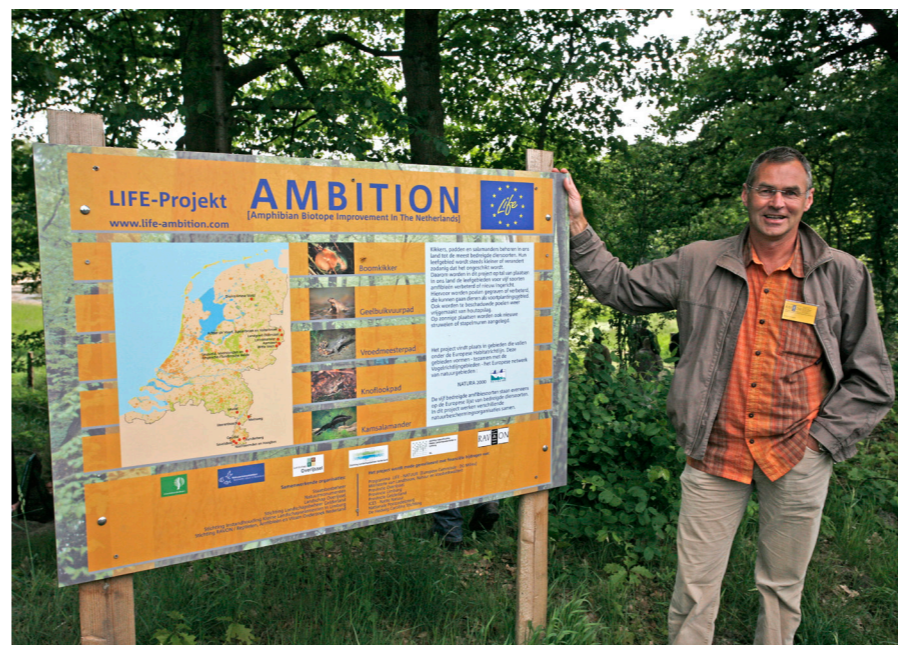
Informatiebord LIFE AMBITION bij Landgoederen Oldenzaal

Het Plan "Vipera verbindt..." is een van de plannen die behoren tot de leefgebiedenbenadering, waarin soortenbeleid breder wordt opgepakt en samenwerkingsverbanden met veel organisaties worden aangegaan. Het plan kwam begin 2008 gereed en bestaat uit concrete uitvoeringsplannen om faunapopulaties en fauna die typisch is voor heideterreinen en hoogveentjes in een viertal gebieden in Overijssel te versterken en met elkaar te verbinden.