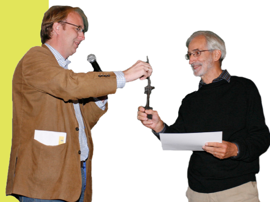
Uitreiking Lendersprijs

RAVON werkt op twee locaties: de Werkgroep Monitoring in Amsterdam coördineert de meetnetten amfibieën en reptielen. In Nijmegen wordt o.a. gewerkt aan verspreidingsonderzoek, soortbescherming, advieswerk voor beheer en inrichting en kennisintensieve opdrachten. Verder werken we aan voorlichting en geven we praktijkgerichte cursussen.