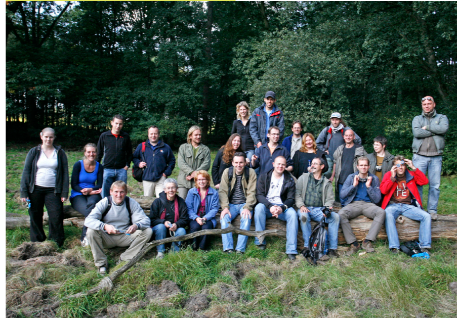
Medewerkers en stagiaires RAVON op de Veluwe