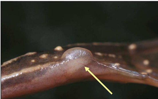
Poelkikker: naar verhouding grote metatarsusknobbel, half-cirkelvormig en symmetrisch.