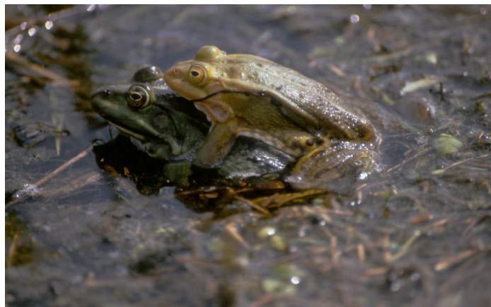
Poelkikkermannetje (boven) in paarhouding met bastaardkikker