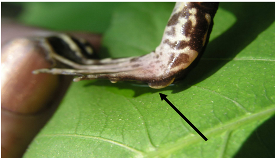
Bastaardkikker: middelgrote/variabele metatarsusknobbel, meestal asymmetrisch met hoogste punt naar de teen toe. Hoogste punt altijd lager dan helft van de lengte. (foto Annemarie van Diepenbeek).