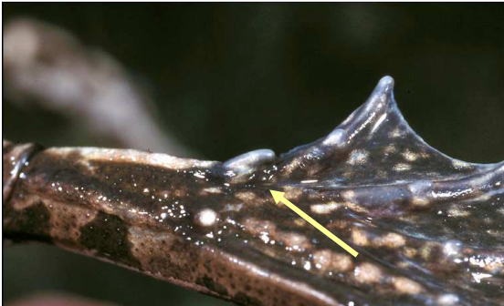
Meerkikker: naar verhouding kleine, zachte metatarsusknobbel, asymmetrisch van vorm, met de hoogste punt naar de teen toe..