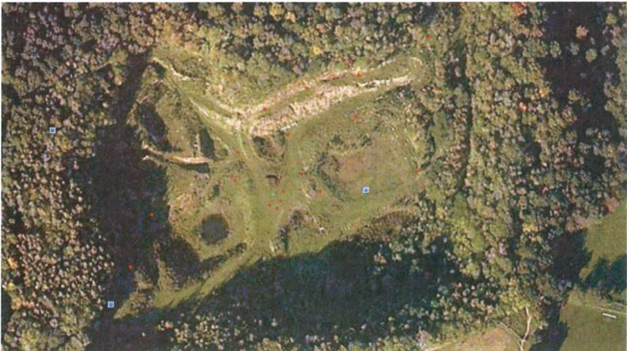
Meertensgroeve. Situatie maart 2009. De locaties van de nieuwe karrensporen zijn globaal aangegeven door middel van een rode stip.